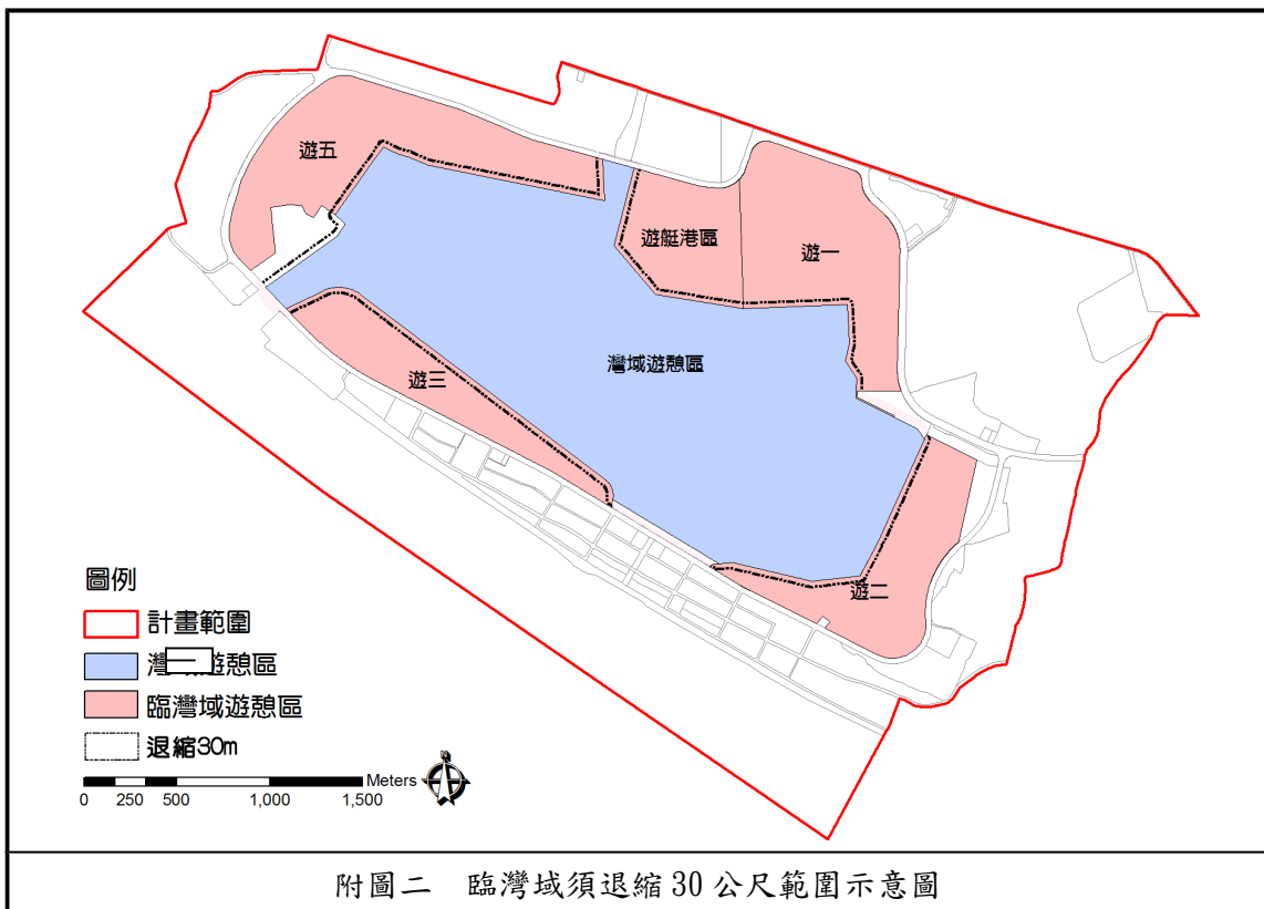
附圖二 臨灣域須退縮 30 公尺範圍示意圖