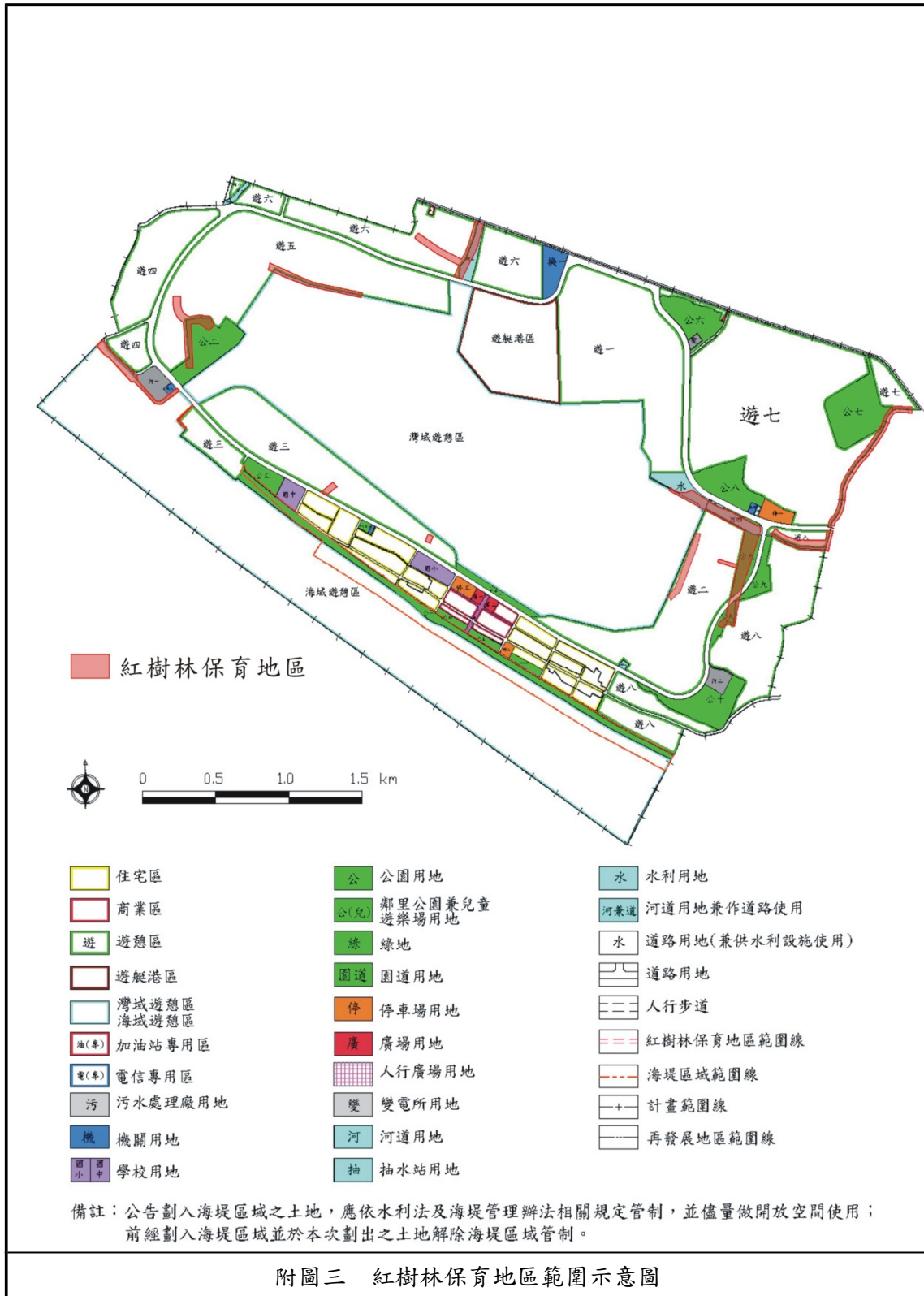
附圖三 紅樹林保育地區範圍示意圖