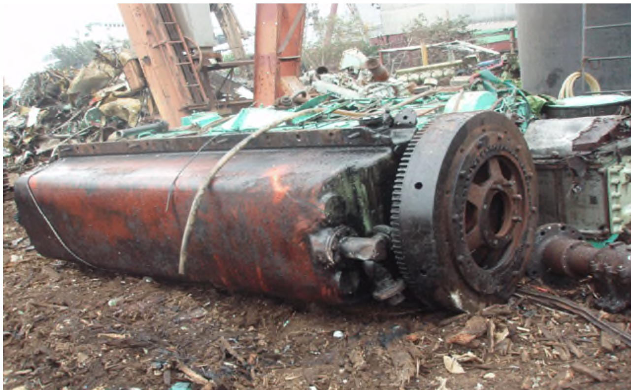
主機引擎曲軸切斷後