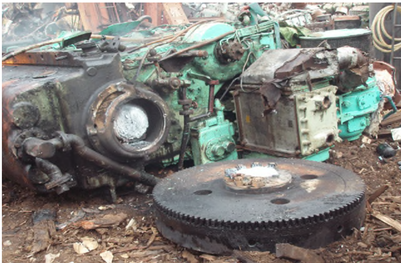
副機引擎曲軸切斷前