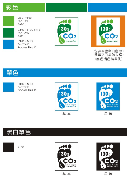
附圖二 標籤使用圖例